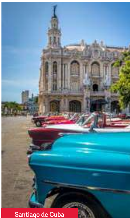
Santiago de Cuba

Después del desayuno, fin de nuestros servicios.