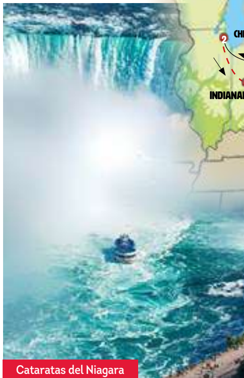
Cataratas del Niágara

Visitaremos el pueblecito de Niágara on the Lake. Embarcaremos en el Hornblower Niágara Cruise. Tiempo libre para disfrutar de atracciones en Clifton Hill.